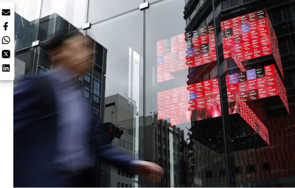
Las movidas empresariales de la semana: Ecopetrol, EPM, Scotiabank Colpatría y Mineros