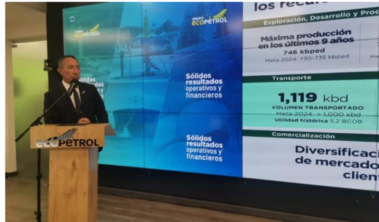
Ecopetrol tomará más deuda en 2025, en parte para comprar otras empresas del sector.

El Grupo Ecopetrol dio a conocer que ve probable volver a la deuda o al mercado internacional para apalancar algunos de sus proyectos en 2025. ¿Qué opciones tiene la petrolera?