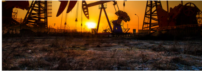
Según Ecopetrol, hubo buena producción de barriles diarios de petróleo.

Según la compañía, esta nueva infraestructura permitirá asegurar fuentes adicionales de abastecimiento de gas natural , un insumo clave para la energía del país. La regasificadora tendrá una capacidad de 60 millones de pies cúbicos por día (MPCD) y estará ubicada en Buenaventura y Buga, Valle del Cauca . Su operación está programada para el segundo trimestre de 2026 .