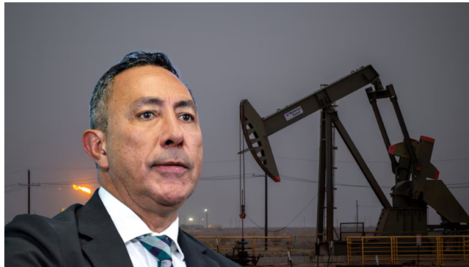
Ricardo Roa, presidente de Ecopetrol, habló sobre los bajos resultados.

A esta disminución se suma una reducción en las ventas totales de la empresa, que cayeron 6,8% , así como una disminución del 14,1% en la utilidad operacional . Estas cifras han generado inquietud entre los inversionistas y accionistas de la compañía