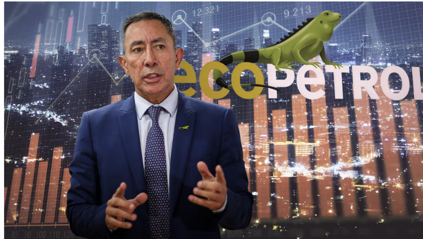
El presidente de la petrolera colombiana, Ricardo Roa, reiteró que no se realizarán transacciones con Venezuela mientras persistan las restricciones impuestas por EE.UU.

5 de marzo de 2025 Por: Redacción El País