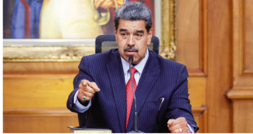
Nicolás Maduro activó el Plan de Independencia Productiva Absoluta

Sin embargo, expertos en el sector energético han señalado que Venezuela enfrenta graves problemas de infraestructura y producción, lo que dificultará que pueda suplir de manera eficiente la ausencia de empresas extranjeras en el país.