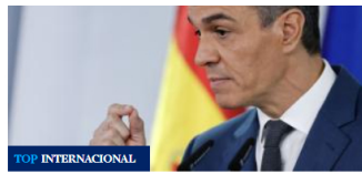
De Baviera a Cataluña: Sánchez otorga autonomía a los independentistas