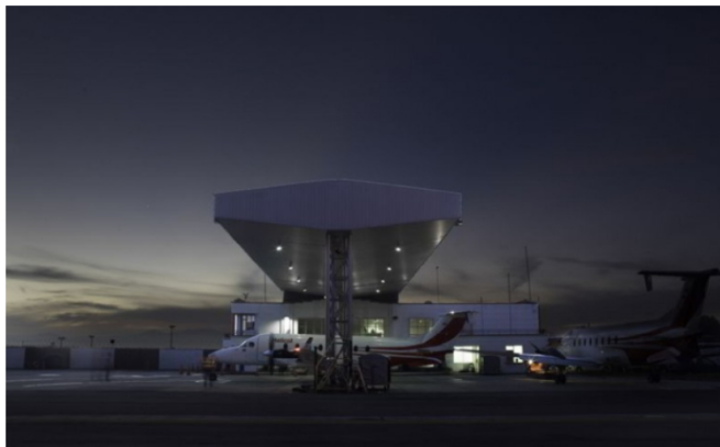
EL TRANSPORTE aéreo de Ecopetrol.

Se agrava la discusión entre la empresa aérea y la petrolera