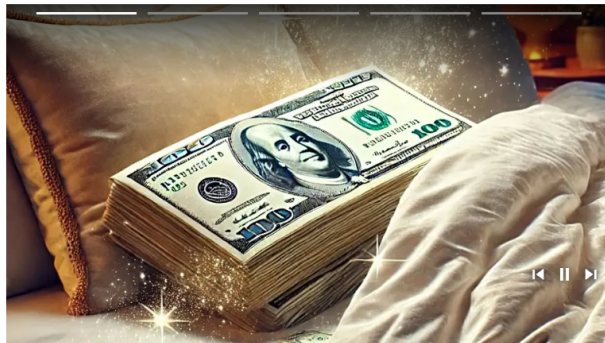
Enlaces Promovidos por Taboola

De otro lado, la ganancia de 2024 fue la cuarta mejor en los últimos 10 años, pero hay varias formas de ver el desempeño.