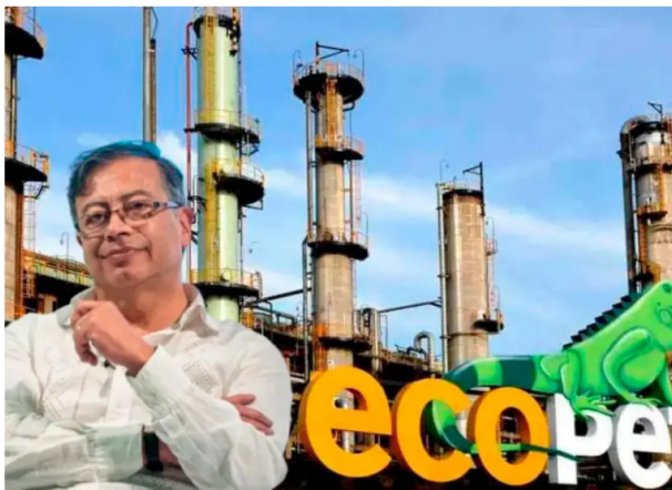
Expertos desmintieron afirmaciones del presidente Gustavo Petro sobre los resultados financieros de Ecopetrol en 2024.

El año pasado, Ecopetrol ganó $14,9 billones, una reducción del 21,7% frente a 2023.