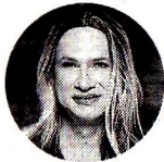
Brigitte Baptiste Rectora de la Universidad EAN

“La estrategia de Susana Muhamad es clara: detener el desarrollo de Bogotá. Con la medida que tomó, se detienen obras de movilidad, vivienda e infraestructura”.