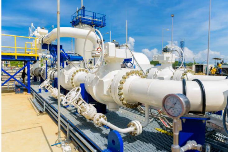
Imagen de referencia de planta de Regasificación en Cartagena | Archivo.

Compartir Este martes, 4 de marzo, Ecopetrol confirmó la adjudicación del primer contrato para tener una planta regasificadora en el Pacífico.