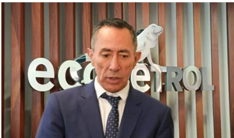
Ricardo Roa, presidente de Ecopetrol .

Ecopetrol obtuvo en 2024 una utilidad neta de $14,9 billones, cifra que es 21,7 % inferior frente al mismo periodo del año anterior, cuando se lograron $19 billones de ganancias.