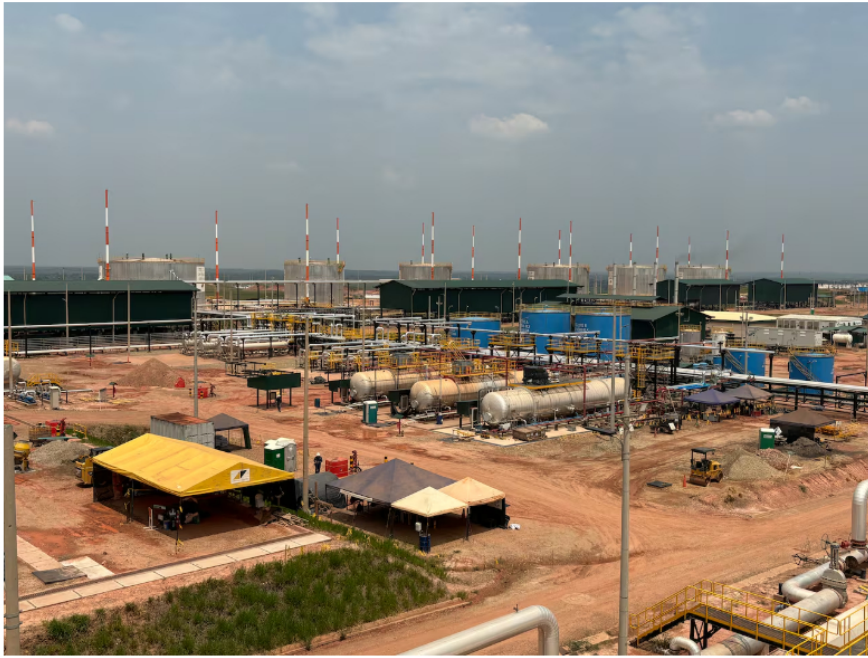
Caño Limón

derechos y exigir transparencia en los procesos de contratación del Grupo Ecopetrol , concluyeron.