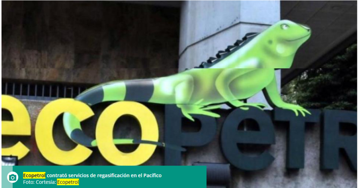
Ecopetrol contrató servicios de regasificación en el Pacífico

La utilidad neta de la petrolera se ubicó en $14.9 billones en el consolidado del 2024. Hace un año fue de $19.1 billones.