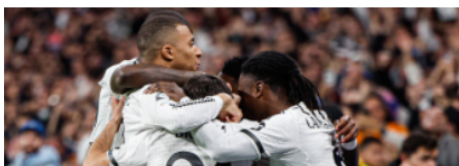
Invima alerta comercialización ilegal de producto fitoterápéutico