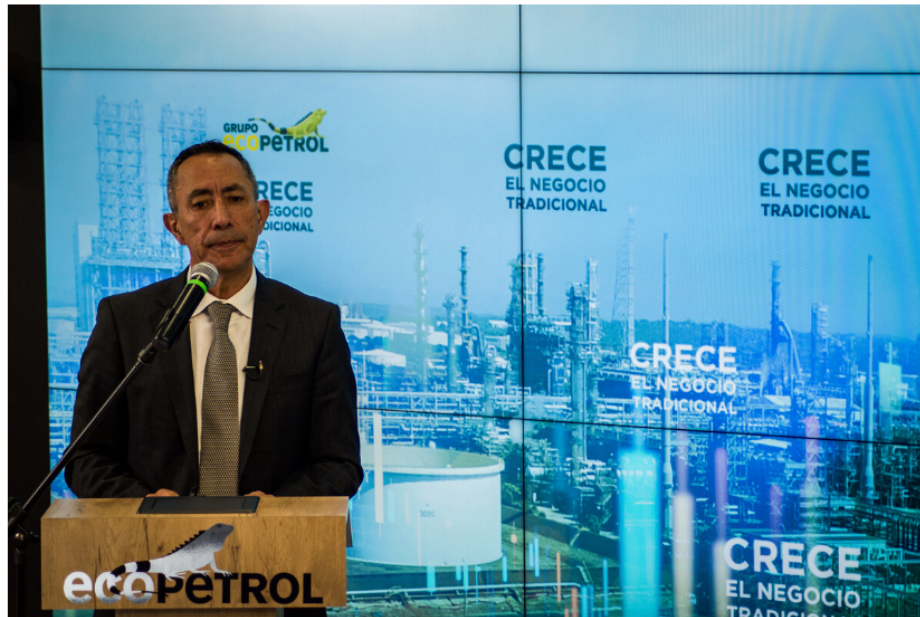
Presidente de Ecopetrol, Ricardo Roa

Uno de los aspectos destacados en el balance de Ecopetrol fue la reposición de reservas , que alcanzó un índice del 104 % , con la incorporación de 260 millones de barriles de petróleo equivalente (MBPE) . En Colombia, este índice fue del 121 % , reflejando el potencial del país en exploración y producción . Asimismo, la adquisición del campo CPO-09 a Repsol permitió sumar 32 MBPE a las reservas totales del grupo.