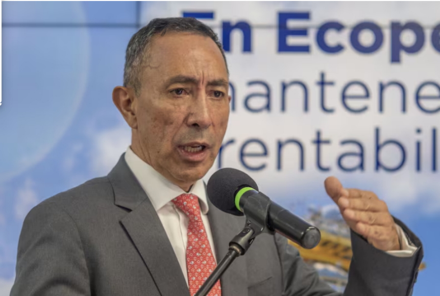
Ecopetrol CEO Ricard Roa Holds Press Conference Ricardo Roa, chief executive officer of Ecopetrol SA, speaks during a press conference at the company headquarters in Bogotá, Colombia, on Tuesday, May 7, 2024.