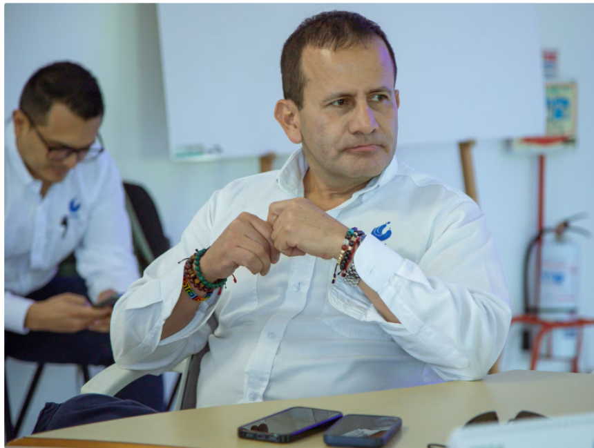
La filial de Ecopetrol afirmó que en ningún momento se le ha pedido la renuncia al presidente

El Gobierno de Gustavo Petro anunció ajustes en su estrategia energética, reflejados en la renuncia de Andrés Camacho como ministro de Minas y Energía, y la designación de Edwin Palma como su sucesor.