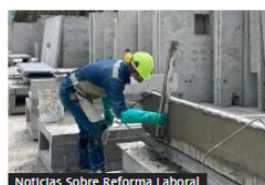
Noticias Sobre Reforma Laboral

Premercado | Bolsas abrieron en rojo arrastradas por las caídas en Asia y Wall Street