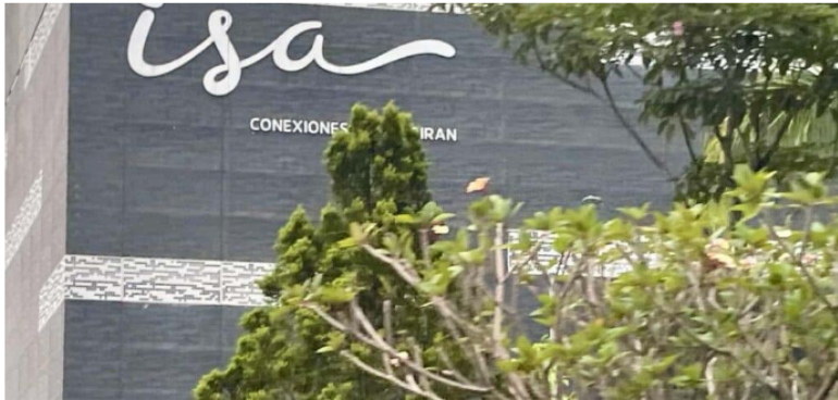
Otros miembros de Junta de ISA también deberán declarar en este proceso.