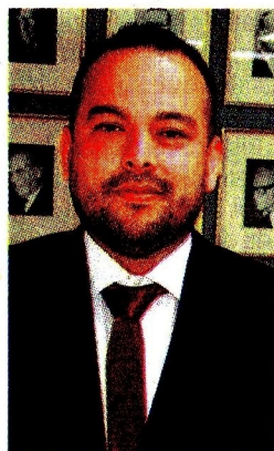
Edwin Palma, nuevo ministro de Minas y Energía.

caído, sino simplemente hubieran mantenido su nivel de producción, el producto interno bruto (PIB) habría crecido 0,3 puntos porcentuales más. Los minerales le restan en ese periodo 11 por ciento al crecimiento.