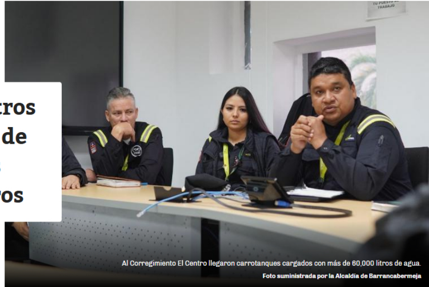
Al Corregimiento El Centro llegaron carrotanques cargados con más de 60,000 litros de agua.

Por: María José Parra Cepeda @mariaj_parra