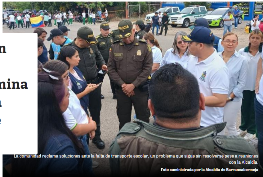
La comunidad reclama soluciones ante la falta de transporte escolar, un problema que sigue sin resolverse pese a reuniones con la Alcaldía.

Por: María José Parra Cepeda @mariaj_parra