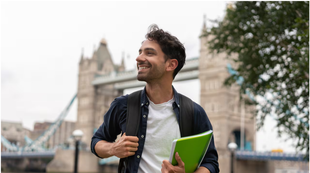
Desde su creación en 1983, el programa Chevening ha transformado la vida de más de 60.000 personas en 160 países

La creación de las Becas Chevening – Ecopetrol para la Transición Energética Justa en Colombia beneficiarán a cuatro profesionales colombianos anualmente dentro los tres periodos académicos entre 2025 y 2028.