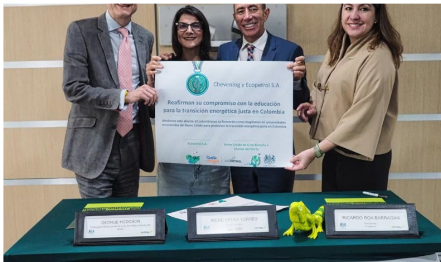
Con esta alianza, Ecopetrol y la Embajada del Reino Unido reafirman su compromiso con la educación, el liderazgo y la sostenibilidad.

Para entrar a participar, los candidatos deben contar con al menos dos años de experiencia laboral , con una oferta de admisión en al menos una universidad británica y un dominio del inglés en niveles equivalentes a B2 o C1. Además, es importante que los aplicantes demuestren excelencia académica y el compromiso de regresar a contribuir con el desarrollo de Colombia , durante al menos dos años después de culminar los estudios.