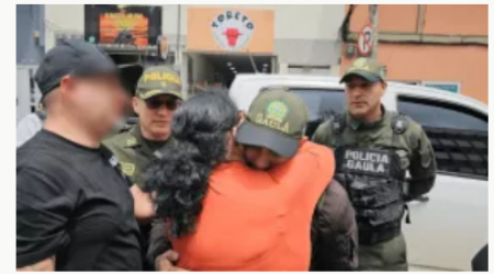
Gaula de la Policía rescata ciudadano secuestrado por delincuencia común