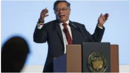
Este es el nuevo gabinete ministerial del presidente Gustavo Petro