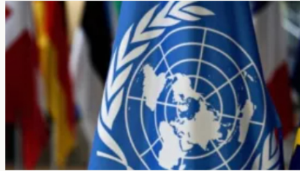
Nicaragua anuncia su retiro del Consejo de Derechos Humanos de la ONU