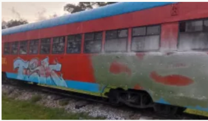
Vandalismo y enfrentamientos en el tren de la Sabana generó pánico en Bogotá