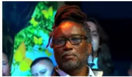
Carlos Rosero asume el Ministerio de Igualdad en reemplazo de Francia Márquez