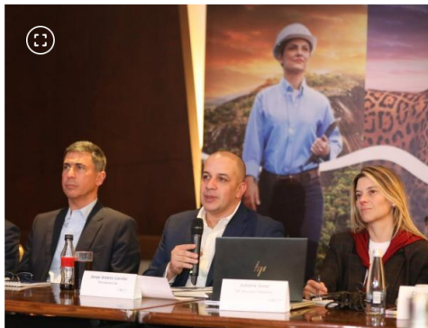
Rueda de prensa sobre los resultados financieros de ISA.

Edwin Palma sería el nuevo ministro de Minas y Energía en reemplazo de Andrés Camacho