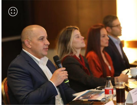
Rueda de prensa sobre los resultados financieros de ISA.

El año pasado ISA también ganó nuevos proyectos de energía eléctrica y vías por 859 millones de dólares. Además, puso en operación proyectos que suman una inversión de 772 millones de dólares.