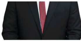
Palma venía de hacer parte de la junta de Ecopetrol.

Sin embargo, fue bastante criticado por algunos sectores por su cercanía con el sindicalismo, por lo que desde el Congreso se cuestionó que, por ejemplo, en el caso de la reforma laboral, se entregaban distintos beneficios a los sindicatos y se afectaba la productividad empresarial.