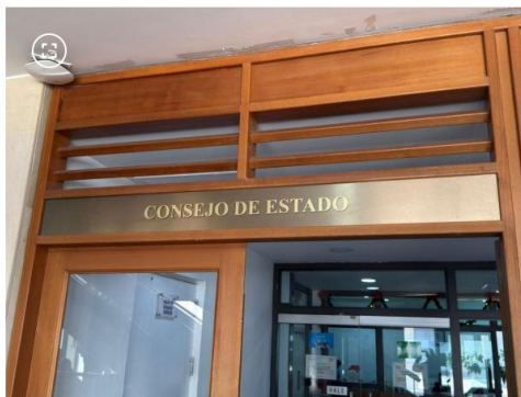
Consejo de Estado.

(Lea también: El plazo perentorio que Tribunal le acaba de dar a la Procuraduría General para llenar 2.776 vacantes de alto nivel )