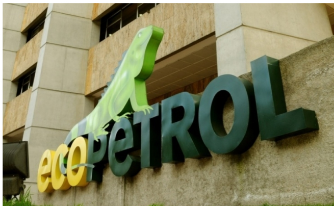
El Consejo de Estado ordenó a la petrolera publicar toda su actividad contractual en SECOP II, salvo documentos reservados por ley, en un plazo de tres meses.

El Consejo de Estado ordenó a la petrolera publicar toda su actividad, salvo los documentos reservados por ley. La decisión revoca un fallo previo y exige transparencia en todas las etapas del proceso contractual.