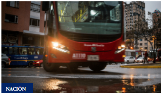
Pronóstico del tiempo en Bogotá para el miércoles 26 de febrero