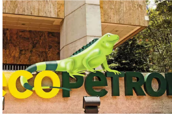
Logo de Ecopetrol.