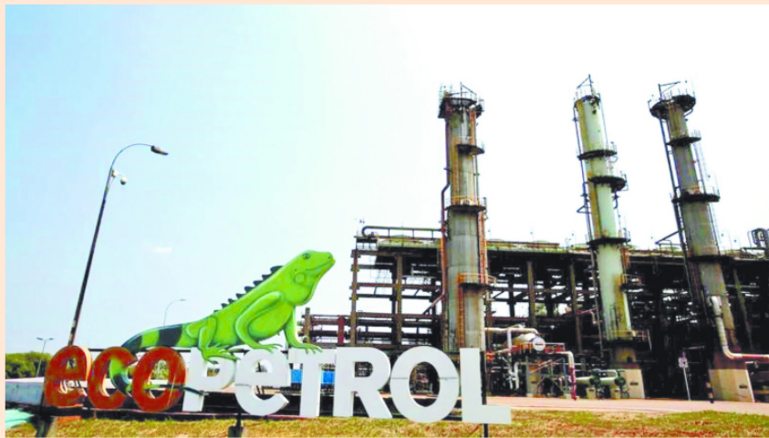
La petrolera colombiana desarrollará dos nuevas instalaciones para el gas importado.

Ecopetrol planea compensar las menguantes reservas de gas natural de Colombia mediante el desarrollo de dos instalaciones que le permitirán importar el combustible a partir del próximo año, dijo su principal funcionario en una entrevista.