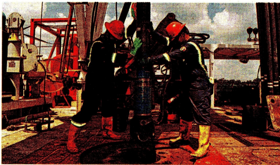
Ecopetrol reveló que el índice de reemplazo de las reservas fue 104%. El Tiempo

En el segmento orgánico, la compañía más grande de Colombia anunció que se incorporaron 231 MBPE principalmente por gestión