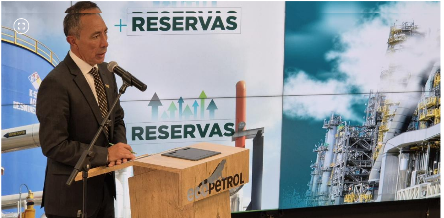
Presidente de Ecopetrol , Ricardo Roa.

La empresa también comenzará a importar gas natural a partir de 2026 por Buenaventura y La Guajira.