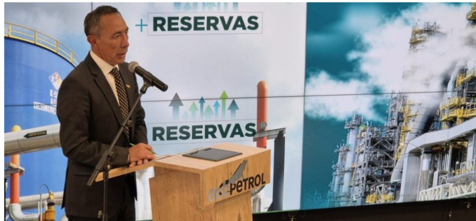
El Grupo Ecopetrol reemplazó el 104% de la producción, duplicando la incorporación de reservas probadas respecto al 2023, anunció el presidente de Ecopetrol , Ricardo Roa Barragán.