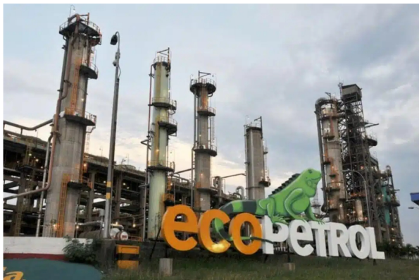
Logo de Ecopetrol en el ingreso a sus instalaciones.