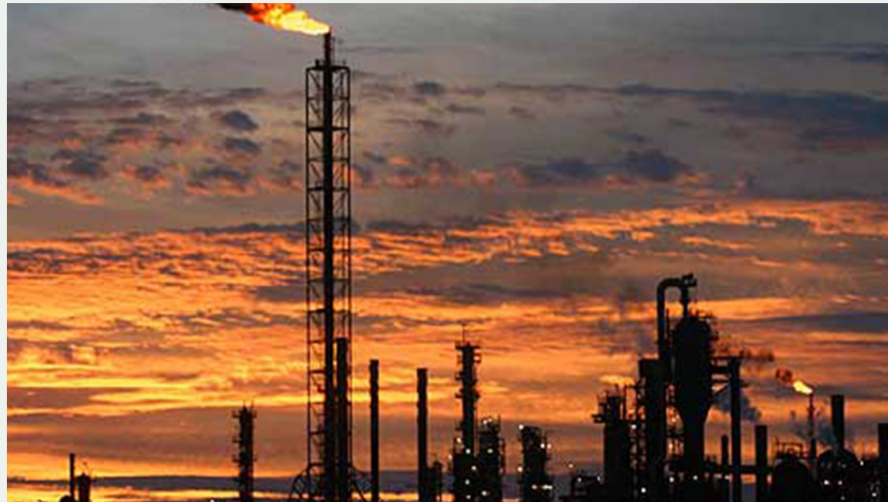
Yacimiento de petróleo en Colombia.