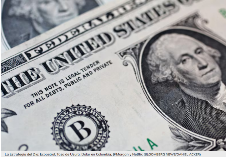
La Estrategia del Día: Ecopetrol, Tasa de Usura, Dólar en Colombia, JPMorgan y Netflix

Hoy hablaremos sobre Ecopetrol, la Tasa de Usura, el dólar, JP Morgan y Netflix