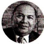
Amylkar Acosta Exministro de Minas y Energía

“Estamos en un mercado de muy corto plazo con total especulación (...) Las tarifas solo van a subir. Los contratos que quedan a plazos largos se vencen en diciembre y ahí todo se va hasta triplicar”.