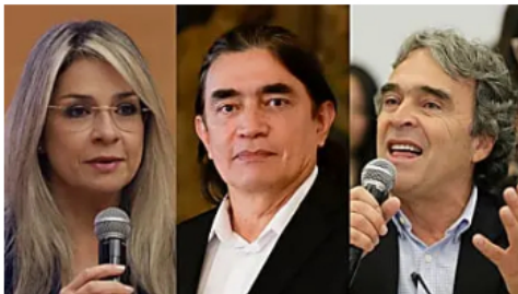
Así van las intenciones de voto para las elecciones presidenciales de 2026