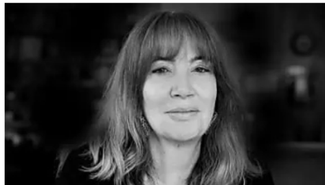
Los audios de Ricardo Roa