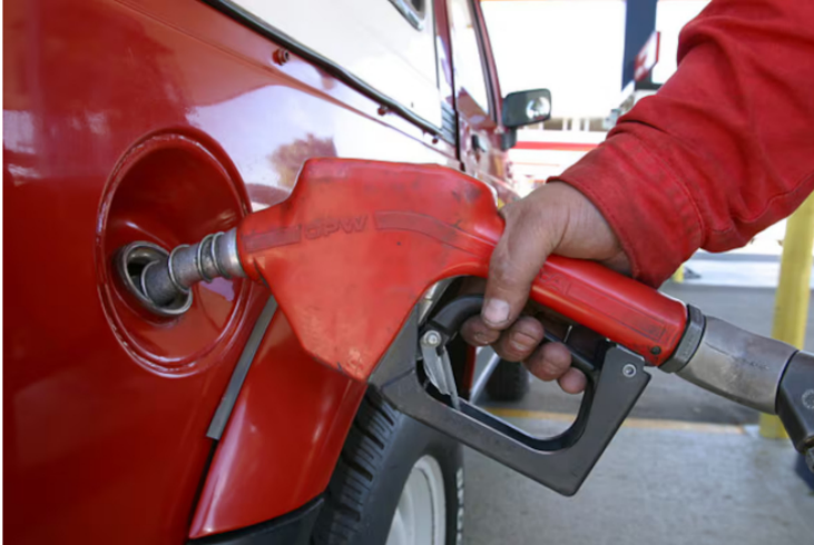
Ecopetrol explicó si la mayor importación de este combustible afectará el precio del combustible.

Compartir El próximo 27 de marzo iniciará la parada de planta Cracking UOP II de la Refinería de Barrancabermeja, una de las unidades clave en la producción de gasolina en el país. En esta unidad se produce cerca del 10 % del combustible del consumo nacional.