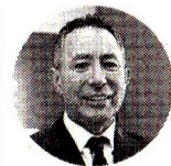
Ricardo Roa Barragán Presidente de Ecopetrol

La petrolera destacó el crecimiento que tuvieron en la ampliación de las reservas pese a