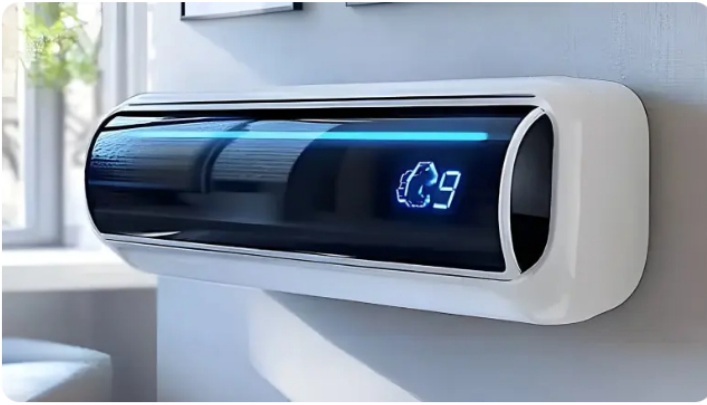
Aire acondicionado moderno: no es necesario romper paredes para instalarlo Aire Acondicionado SplitMax | Patrocinado