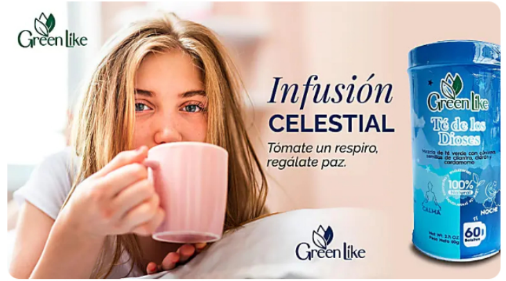
Bebe este té relajante y disfruta de un sueño profundo y reparador todas las noches GreenLike® | Patrocinado