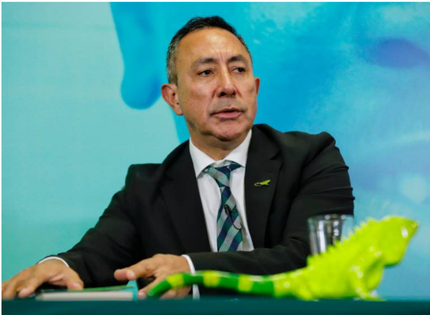
Ricardo Roa, presidente de Ecopetrol, divulgó las cifras de reservas de la compañía petrolera.

El incremento de reservas es uno de los pilares de la estrategia del Grupo Ecopetrol.