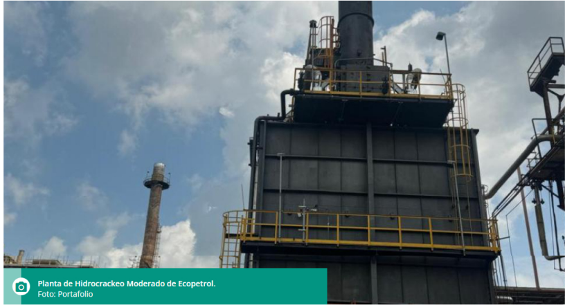
Planta de Hidrocrackeo Moderado de Ecopetrol.

La inversión para poner en funcionamiento esta nueva unidad de Hidrocrackeo Moderado fue de US$35.3 millones.