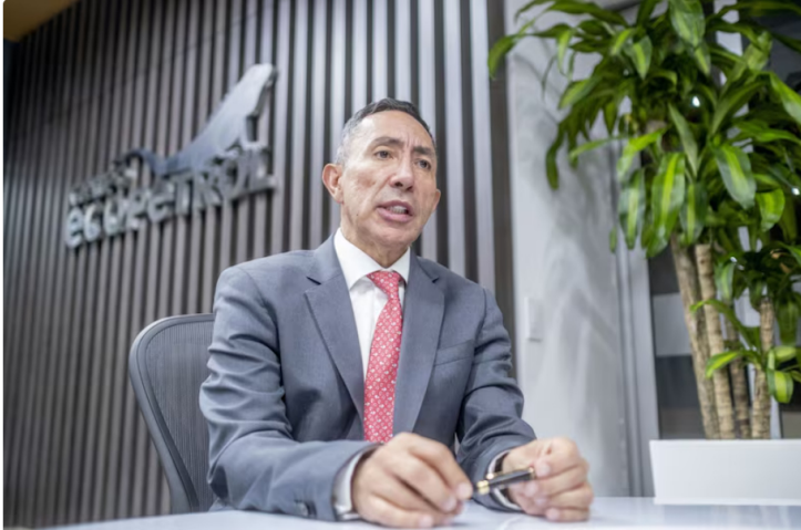
Ricardo Roa, presidente de Ecopetrol. La Estrategia del Día: Habla Ricardo Roa, presidente de Ecopetrol: ¿por qué va bien la acción?

Hoy estamos al aire con Ricardo Roa, presidente de Ecopetrol, quien habla sobre el buen momento de la acción de la petrolera estatal