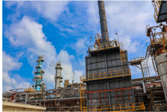
En los trabajos de construcción, montaje y gerenciamiento de la planta Hidrocracking Moderada (HCM) participaron cerca de 800 trabajadores directos y aliados y más de 30 empresas internacionales, nacionales y locales.

Ecopetrol da un nuevo paso en su compromiso de producir combustibles de alta calidad y avanzar en la transición energética. Con una inversión de 35.3 millones de dólares, la Empresa actualizó la planta de Hidrocracking Moderada (HCM) de la refinería de Barrancabermeja, que le permite producir diésel de 10 partes por millón (ppm) de azufre para el consumo de todo el país.