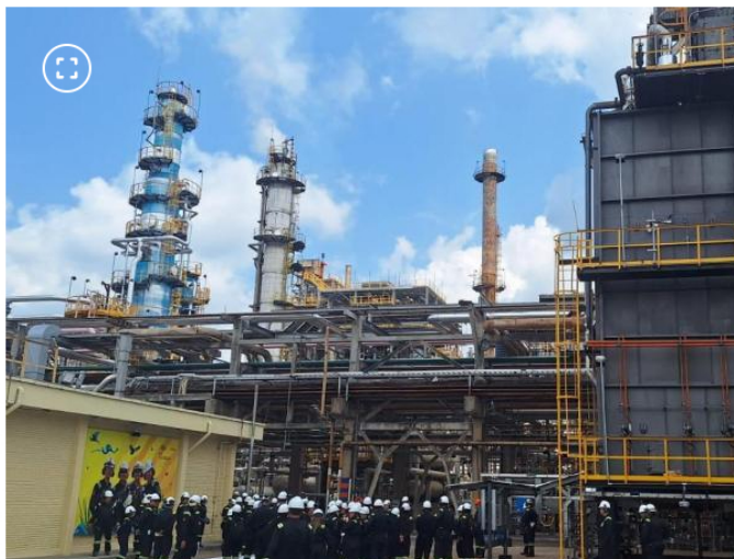
Planta de hidro craqueo moderado.

Nubank abrió vacantes para trabajar remoto; estos son los perfiles y requisitos para postularse