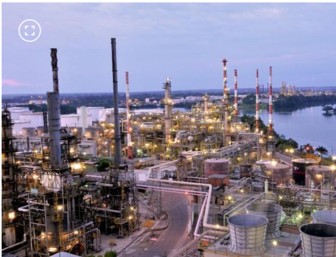
Refinería de Barrancabermeja

Las 57 demandas que han llegado a la Corte Constitucional para tumbar la reforma pensional