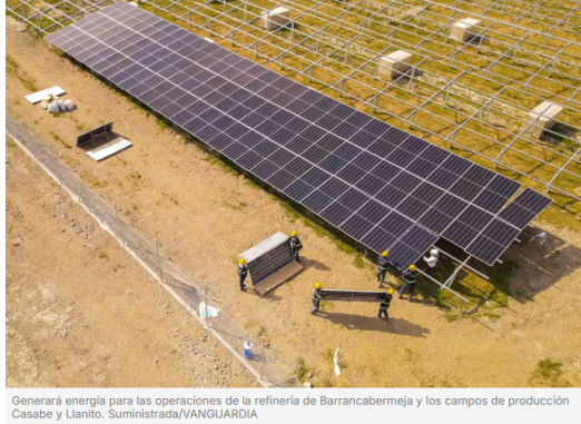
Generará energía para las operaciones de la refinera de Barrancabermeja y los campos de producción Casabe y Llanito.

El proyecto solar, parte del plan de inversiones 2024-2026, busca impulsar la seguridad energética y acelerar la transición a energías limpias.