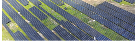
Ecopetrol inauguró la Granja Solar La Cira Infantas, granja fotovoltaica que cuenta con una capacidad instalada de 56 millones de kilovatios.

En su propósito de seguir aportando a la transición energética, desde agosto de 2022 hasta el cierre de año 2023, el Grupo Ecopetrol ha incorporado 161 megavatios (MW) de potencia instalada operativa; y al cierre de 2024, su portafolio de energías renovables registró entre 700-800 MW de capacidad en proyectos en ejecución, construcción y operación.