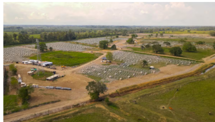
La granja solar reducirá emisiones cercanas a 26.000 toneladas de CO 2 anuales.

El proyecto completa 51.990 horas de trabajo con la participación de 188 personas, de las cuales 163 son habitantes de la zona donde se adelanta la obra, incluidas 35 mujeres, 29 de ellas madres cabeza de hogar. Lea también: Refinería de Barrancabermeja: 103 años de historia y progreso