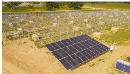
La Granja Solar La Iguana hace parte del Plan de Inversiones que la Refinería de Barrancabermeja dispuso para el periodo 2024-2026.

Así puede tener una casa con sus cesantías