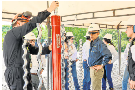
Granja solar La Cira

La Granja Solar ubicada en la vereda Campo 23, del corregimiento El Centro, en Barrancabermeja, Santander, produce energía a partir de 84.900 paneles solares en estructuras fijas, que ocupan 53 hectáreas, el equivalente a 49 canchas de fútbol profesionales.