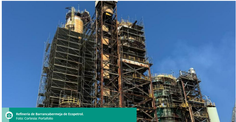
Refinería de Barrancabermeja de Ecopetrol.

El tiempo de ajuste iniciará el próximo 27 de marzo del 2025 y tendrá una duración de 74 días.