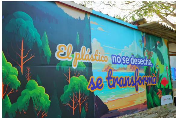
Mural en la institución.

Carrotaques de La Guajira, entregados en Cartagena por la UNGRD