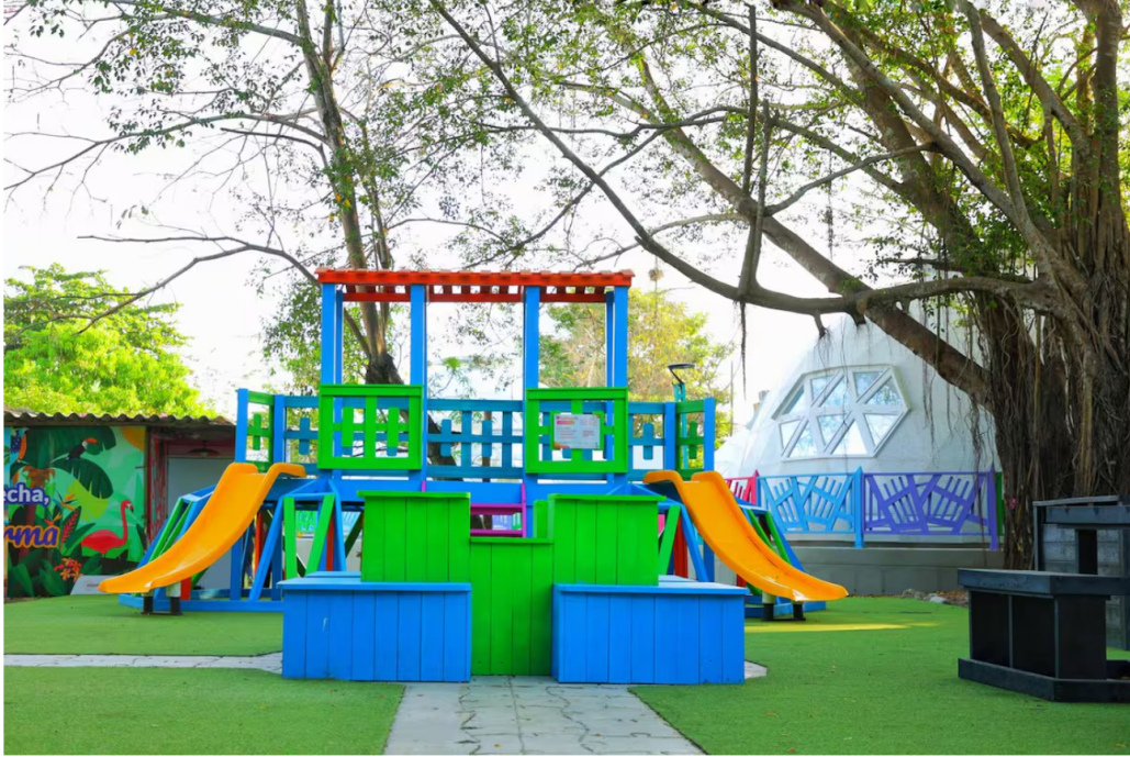
Aula completamente sostenible.

En búsqueda de fomentar el cuidado ambiental, una empresa del Grupo Ecopetrol entregó seis aulas sostenibles nuevas para niños de la institución.