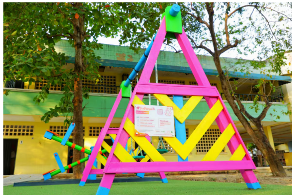
Espacio recreacional sostenible.

“Se trata de una apuesta de economía circular y protección del medio ambiente que se conjuga perfectamente con el interés de la educación en estas nuevas generaciones. Estamos aumentando aulas, acogiendo en ambientes escolares de vanguardia a la población y al mismo tiempo enseñándoles la importancia de proteger el planeta” puntualizó el Secretario.