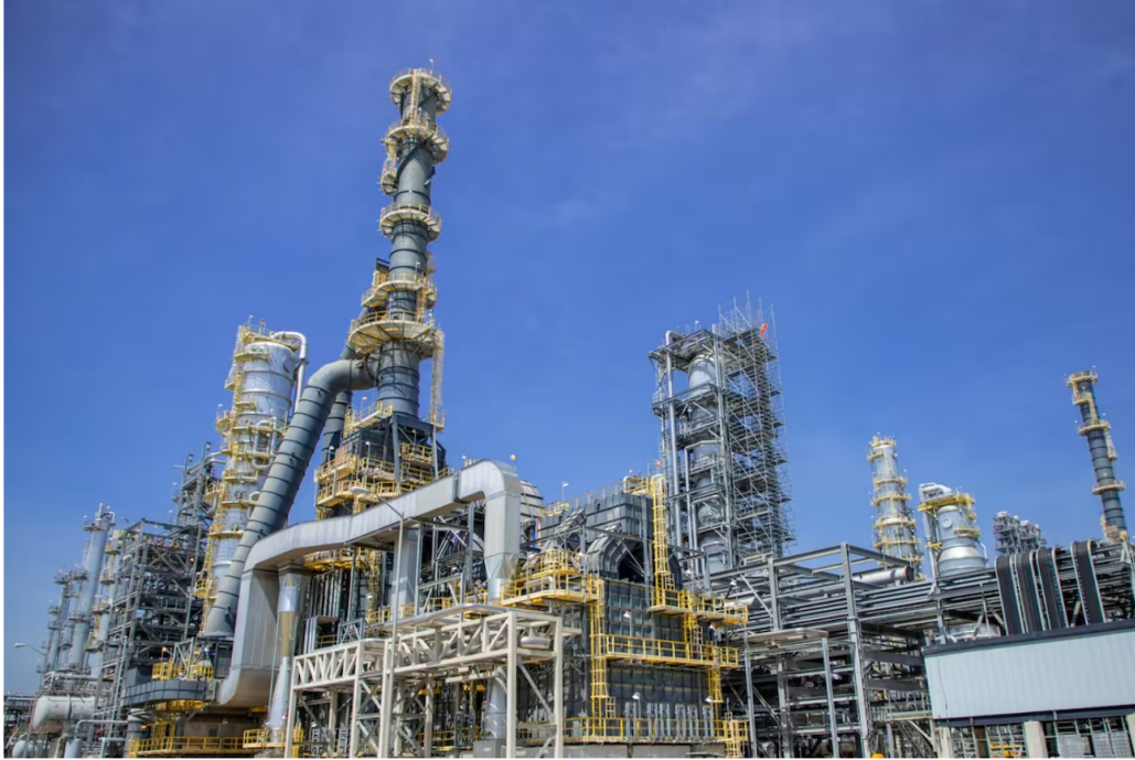
Refinería de Cartagena. //Foto de archivo.

Ecopetrol actualizó información sobre los avances en la recuperación del sistema eléctrico en la Refinería de Cartagena.