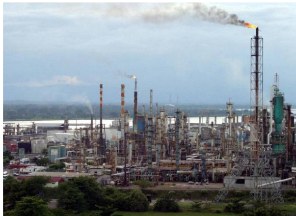
La petrolera aumentará importaciones para suplir la demanda interna por el mantenimiento de la Refinería de Barrancabermeja. FOTO: Colprensa.

A partir de marzo y por 74 días, Ecopetrol reducirá en un 10% la producción de gasolina debido a un mantenimiento clave en la Refinería de Barrancabermeja.