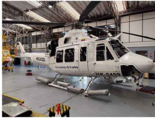
(Foto tomada el día sábado 12 de febrero en los Hangares de Helicol ubicados en la Nueva Zona de Aviación General del Aeropuerto El Dorado en Bogotá)

Es decir, la empresa dice que logró tener los helicópteros listos en los hangares de Bogotá para ser revisados y que les dieran la respectiva autorización de operación, pero solo hasta el pasado 10 de febrero los inspectores de la Aerocivil adelantaron la diligencia.