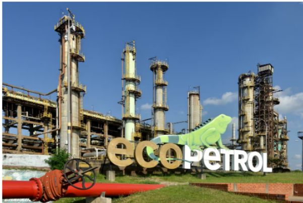
Ecopetrol se destaca por la generación de empleo a nivel nacional y regional.

La Regional Central, conformada por los departamentos de Santander, Norte de Santander, Antioquia, Boyacá, Cundinamarca, Bolívar y Cesar, se destaca por haber registrado el mayor número de empleos a nivel nacional en 2024, con un total de 27.407 vinculaciones acumuladas.