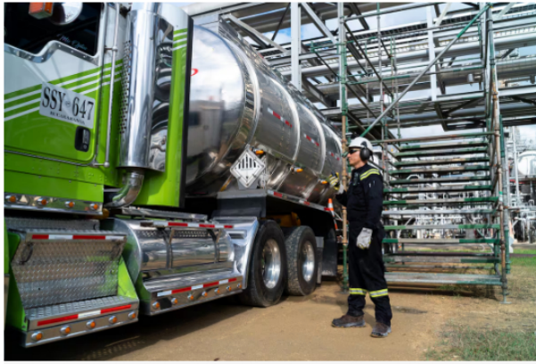
Aceite de palma y aceite usado de cocina, materias primas para el combustible sostenible de aviación, SAF, por sus siglas en inglés.

Asimismo, se trabaja en el diseño de una unidad con capacidad de carga de 6 mil barriles por día, para producir combustible a partir de aceites vegetales, con la alternativa de incorporar más adelante biomasa y otras materias primas.