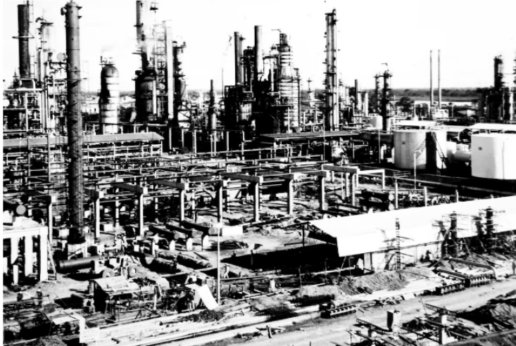
Las operaciones se iniciaron con una carga de 1.500 barriles de crudo y la entrega de cuatro productos.

Compartir Ecopetrol se prepara para festejar los 103 años de operaciones de la refinería de Barrancabermeja, que es el centro de refinación y petroquímica más importante del país.